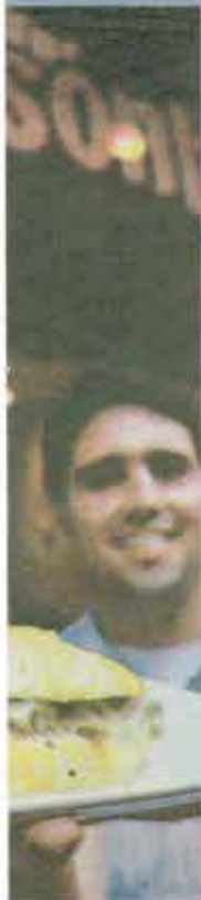
... são ... nho

os destaques. Não e moquecas, como a R$ 15,90, para duas com arroz branco, 70 opção é o bobó arroz branco e farofa suas pessoas). Para gestão é a casquinha R$ 17,90, intas são caseiras e a e no azeite. Rua chieta. (31) 3221- 3h; ter. e rh/Oh; qui. e sex., sôh., 12h/1h; dom.,